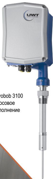
Nivobob 3100 Тросовое исполнение

Производитель силосных конструкций фирма Zeppelin в своих силосах успешно устанавливает ротационные датчики уровня Rotonivo® и электро-механическую лотовую систему серии Nivobob®.